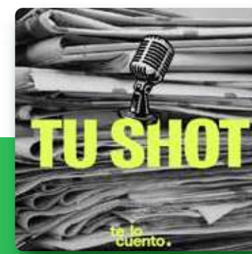
Tu Shot Te lo cuento