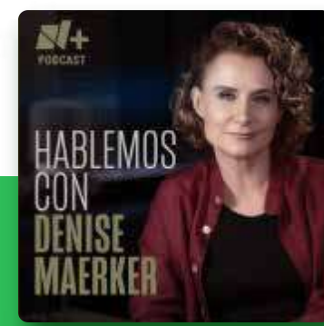
Hablemos con Denise Maerker N+