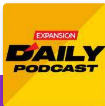
Expansión Daily Grupo Expansión - Gonzalo Soto