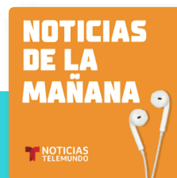
Noticias de la mañana Telemundo