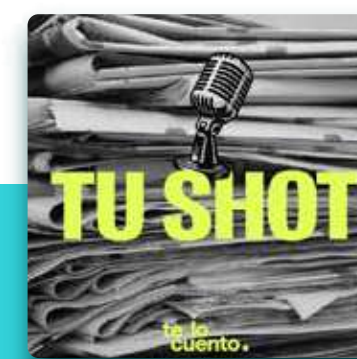
Tu Shot Te lo cuento