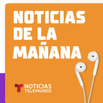
Noticias de la mañana Telemundo